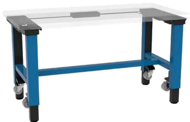
move X2 Mobil Version mobile avec jeu de roues et traverse