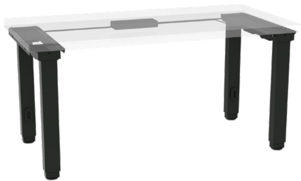
move X2 Basic Version de base avec deux pieds (4 colonnes de levage)