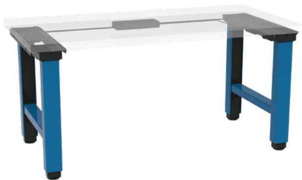
move X2 Pro Extension à l'aide d'un cache pour pieds dans une couleur au choix et d'une barre de liaison pour pieds